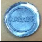
Punzone in Acciaio Temperato (DM 93/2017) Ø 8.8 per pinza standard

Nel caso di verificazioni effettuate dal Fornitore Esterno, è sua cura apporre i propri contrassegni in accordo alle modalità sopra riportate.